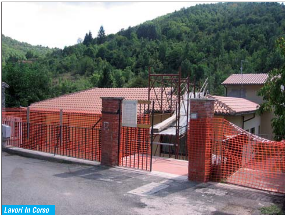
Lavori In Corso

Per rimediare a questa situazione l'attuale Amministrazione ha ottenuto dalla Regione Lazio Assessorato all'ambiente e alla Cooperazione dei Popoli - un finanziamento di 160.000 Euro. Tutto questo permetterà finalmente di avere anche a Percile una struttura in grado di soddisfare le sempre più frequenti richieste di ospitalità che provengono sia da turisti occasionali quanto da associazioni ed Enti che qui svolgono alcune delle loro attività e vorrebbero approfittare di una sistemazione logistica migliore.