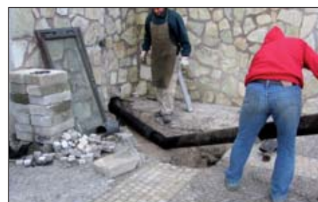
Lavori Risanamento Idrico

idrica che presenta continui e ricorrenti problemi di varia natura. Al fine di porre rimedio ad una situazione che presenta elementi di costante criticità sono stati pianificati una serie