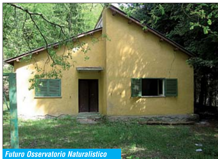
Futuro Osservatorio Naturalistico

C on apposito decreto del Ministero dell'Ambiente dell'11 Febbraio 2008, i Lagustelli sono stati inseriti nell'ambito delle zone di importanza internazionale "Ramsar" (G.U. n° 130 del 5/06/2008).