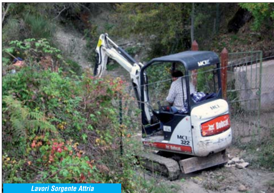
Lavori Sorgente Attria

L'ultimo finanziamento per un importo complessivo di 420.000 Euro, ottenuto dall'attuale Amministrazione Comunale riguarda le opere di risanamento della rete