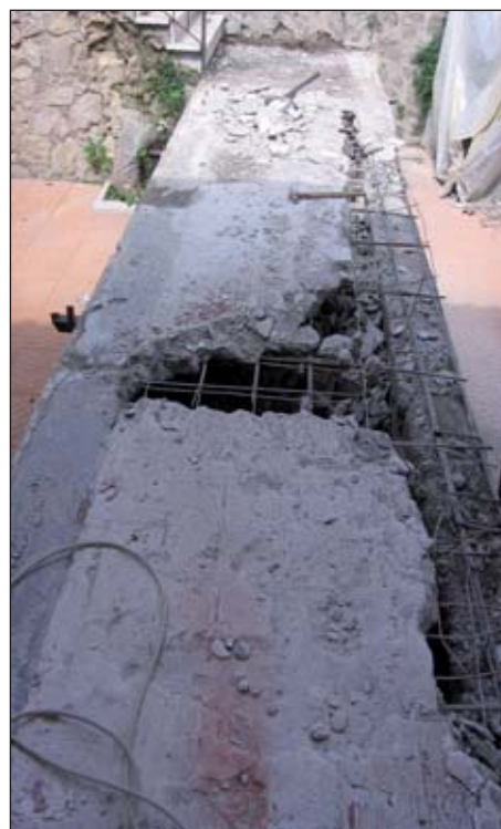
Realizzazione Nuovo Piazzale