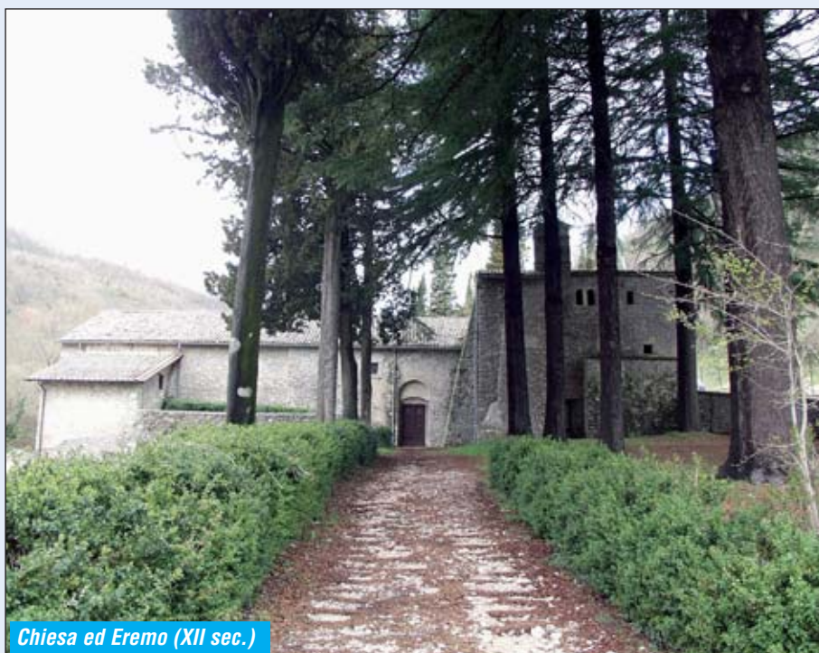
Chiesa ed Eremo (XII sec.)

Ciò comporterà lo spostamento del blocco di loculi cimiteriali attualmente posti a ridosso della parete suddetta e causa principale dei danni arrecati ad essa, che verranno trasferiti in una struttura creata ad hoc all'interno del Cimitero stesso. Con il recupero completo di questa