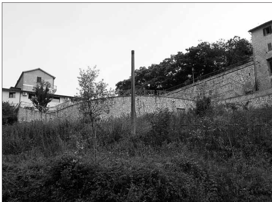
Are in completo dissesto

D opo un iter travagliato, prenderanno avvio i lavori per la completa riqualificazione del Parco Pubblico dell'Ortaccia che, attualmente versa in uno stato di pericoloso dissesto.